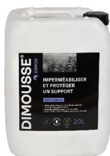
Ref. 444 150 DIMOUSSE Hydro