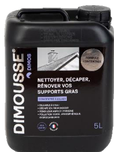
Ref. 444 170 DIMOUSSE Dégraissant concentré