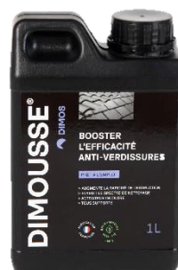
Ref. 444 180 DIMOUSSE Solution booster anti-verdissures