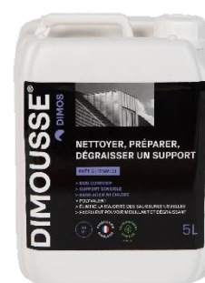
Ref. 444 160 DIMOUSSE Clean 2 en 1